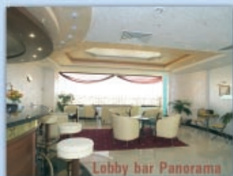
Lobby bar Panorama

97, Bulgaria Blvd, Plovdiv Tel. +359 32/95 18 30; 91 03 E-mail: marketing@sphotel.net www.sphotel.net